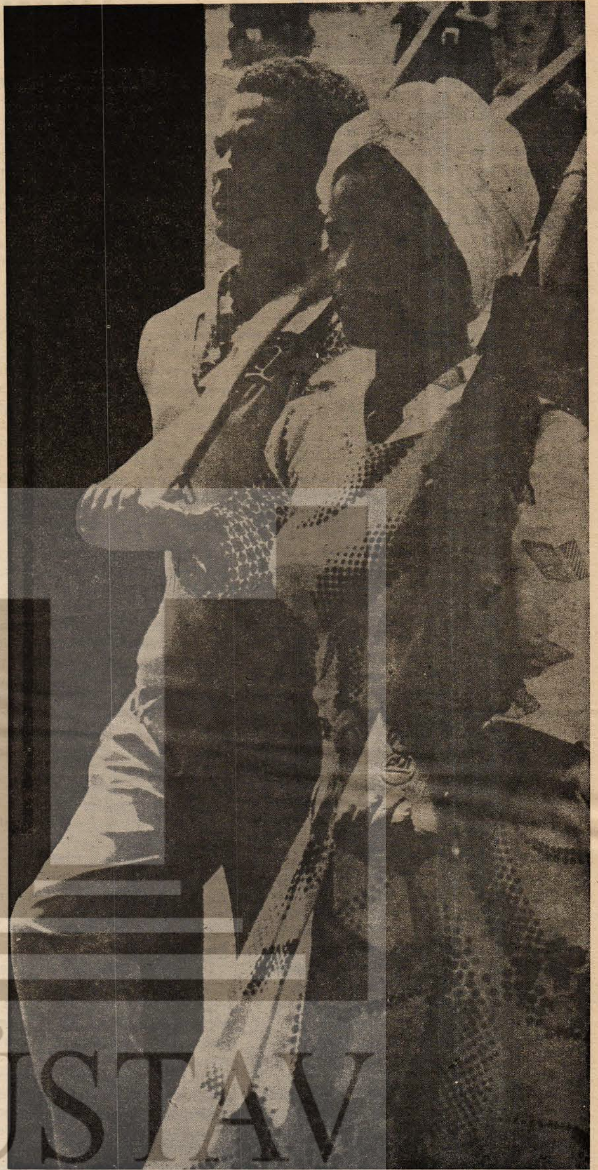
— Etiyopya halkı haklı mücadelesinde omuz omuza...

Bu soruların cevapları tam bir diyalektik dersidir. Yoksulluk ve baskının objektif